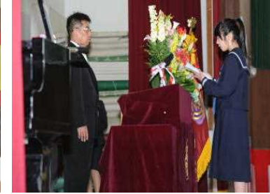
〔新入生誓いの言葉〕