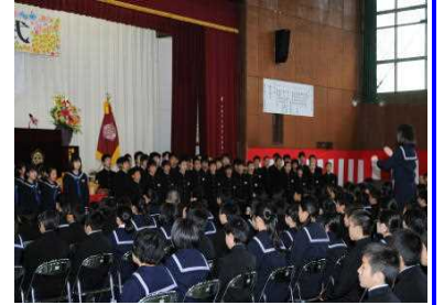
〔有志合唱団による校歌の発表〕